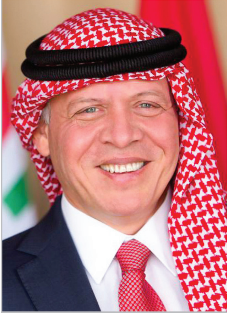
حضرة صاحب الجلالة الملك عبد الله الثاني بن الحسين المعظم (حفظه الله)