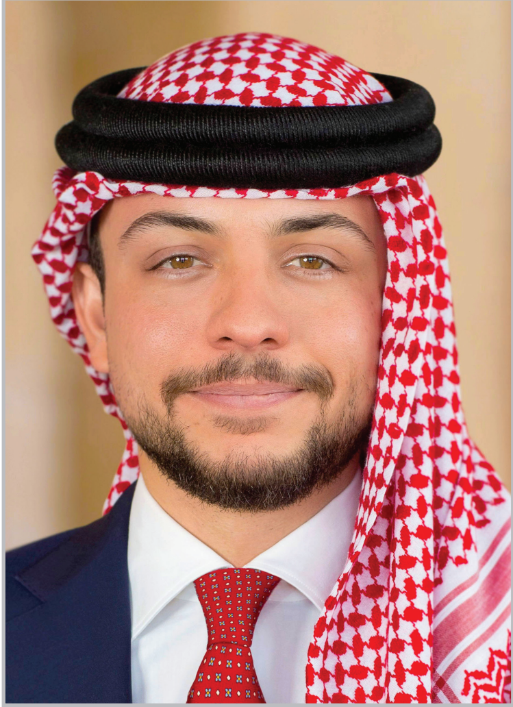
حضرة صاحب السمو الملكي الأمير الحسين بن عبد الله الثاني ولي العهد المعظم (حفظه الله)